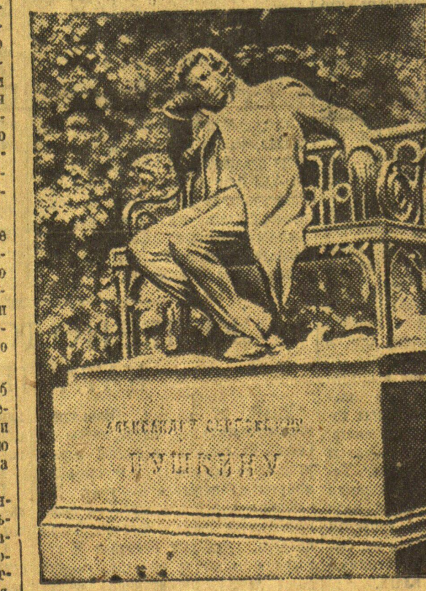
Памятник Пушкину в Екатерининском парке Детского села, работа скульптора База. Памятник поставлен в связи с празднованием столетнего юбилея со дня смерти Пушкина. На цоколе помещены отрывки из стихотворений Пушкина. Среди них отрывки из «Евгения Онегина».

за 26 января Добыто 8000 тонн — 77 проц. Пробурено 583 метр.— 61 %